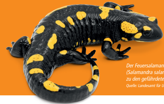
Der Feuersalamander ( Salamandra atra ) gehört zu den gefährdeten Arten.

WINNENDEN STECKT VOLLER ENERGIE - ÖKOSTROM & GAS GÜNSTIG UND REGIONAL.